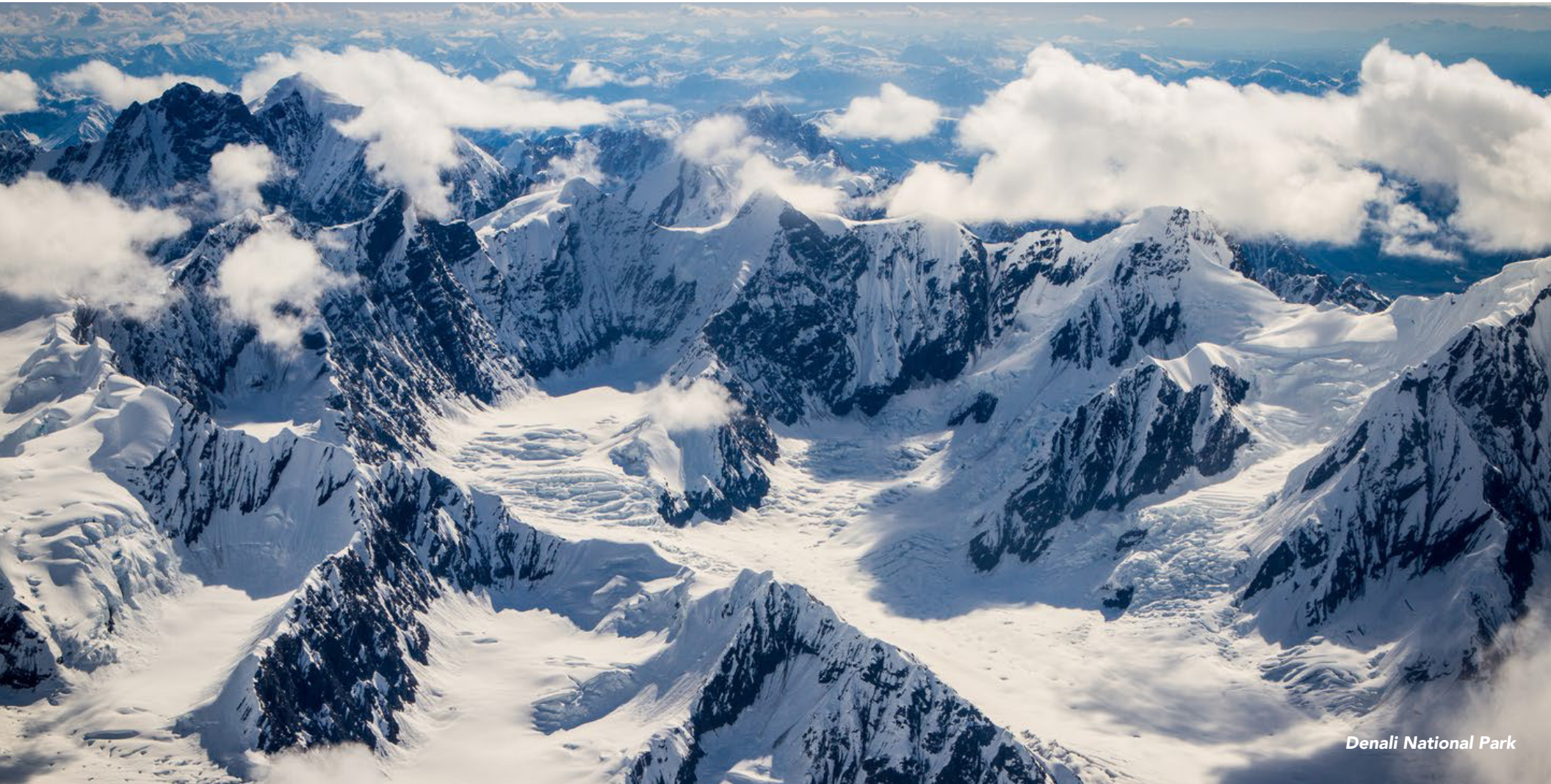
Denali National Park

미국 전역의 자세한 여행 정보 및 아이디어를 보려면 GoUSA.or.kr 을 방문해보세요.