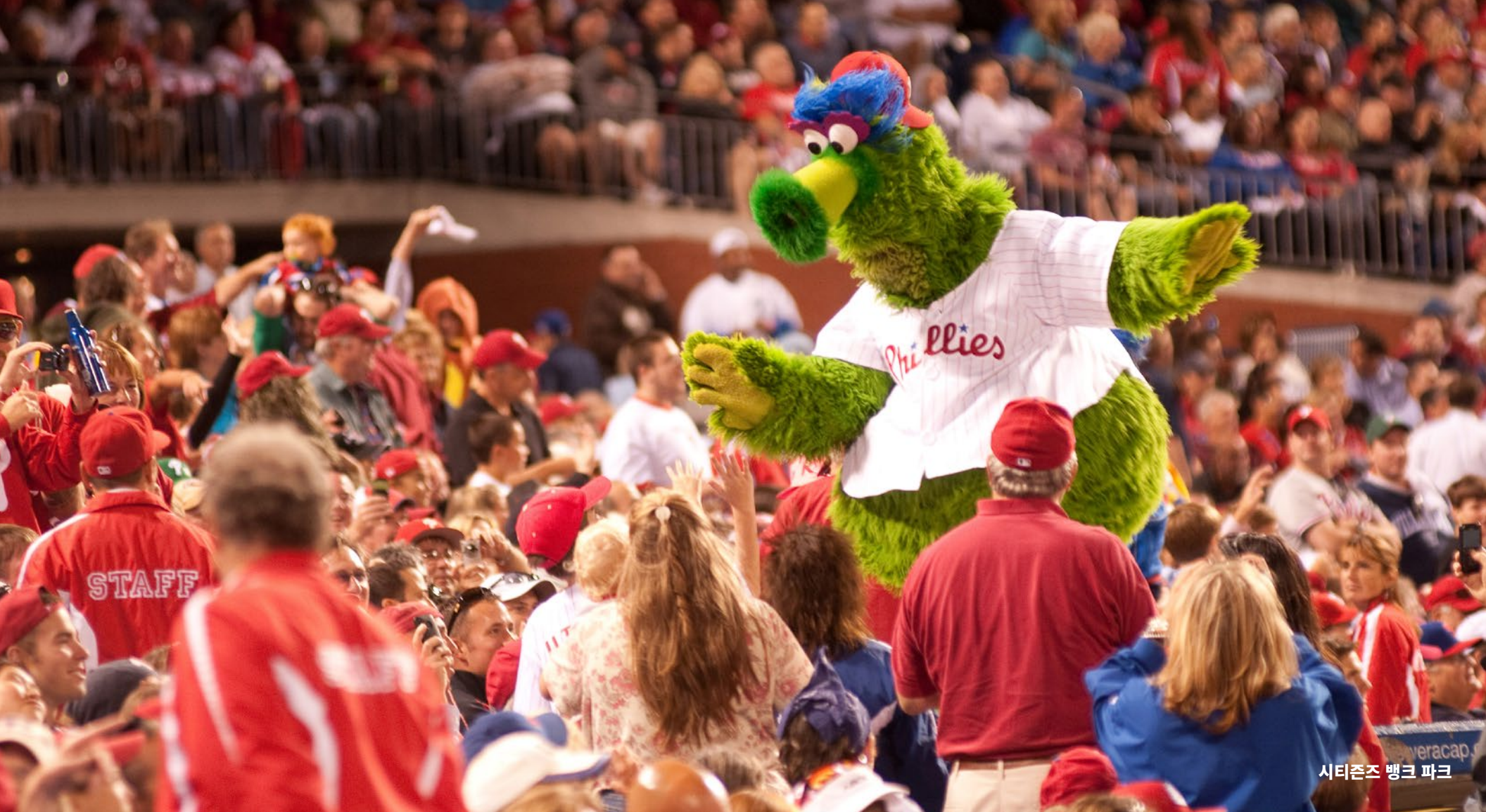
시티즌즈 뱅크 파크