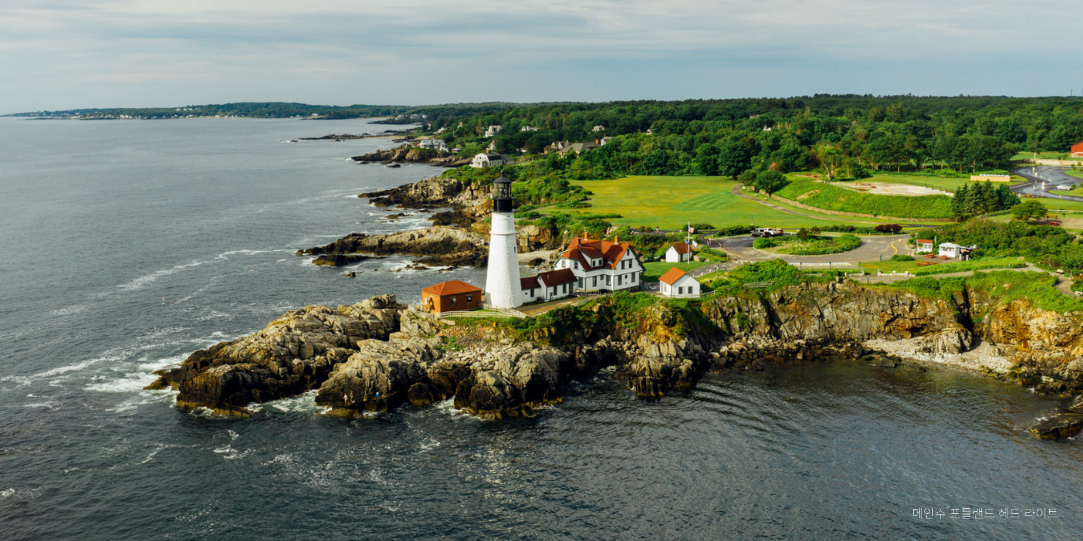
메인주 포틀랜드 헤드 라이트