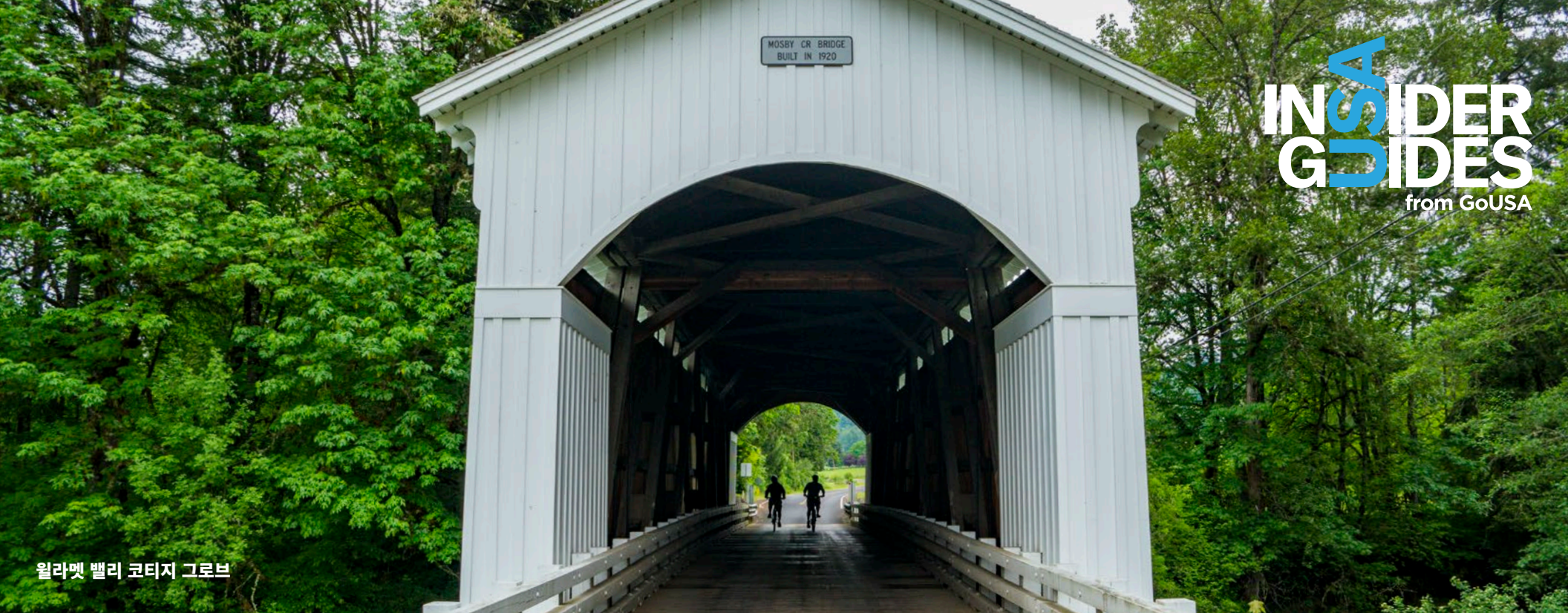
윌라멧 밸리 코티지 그로브