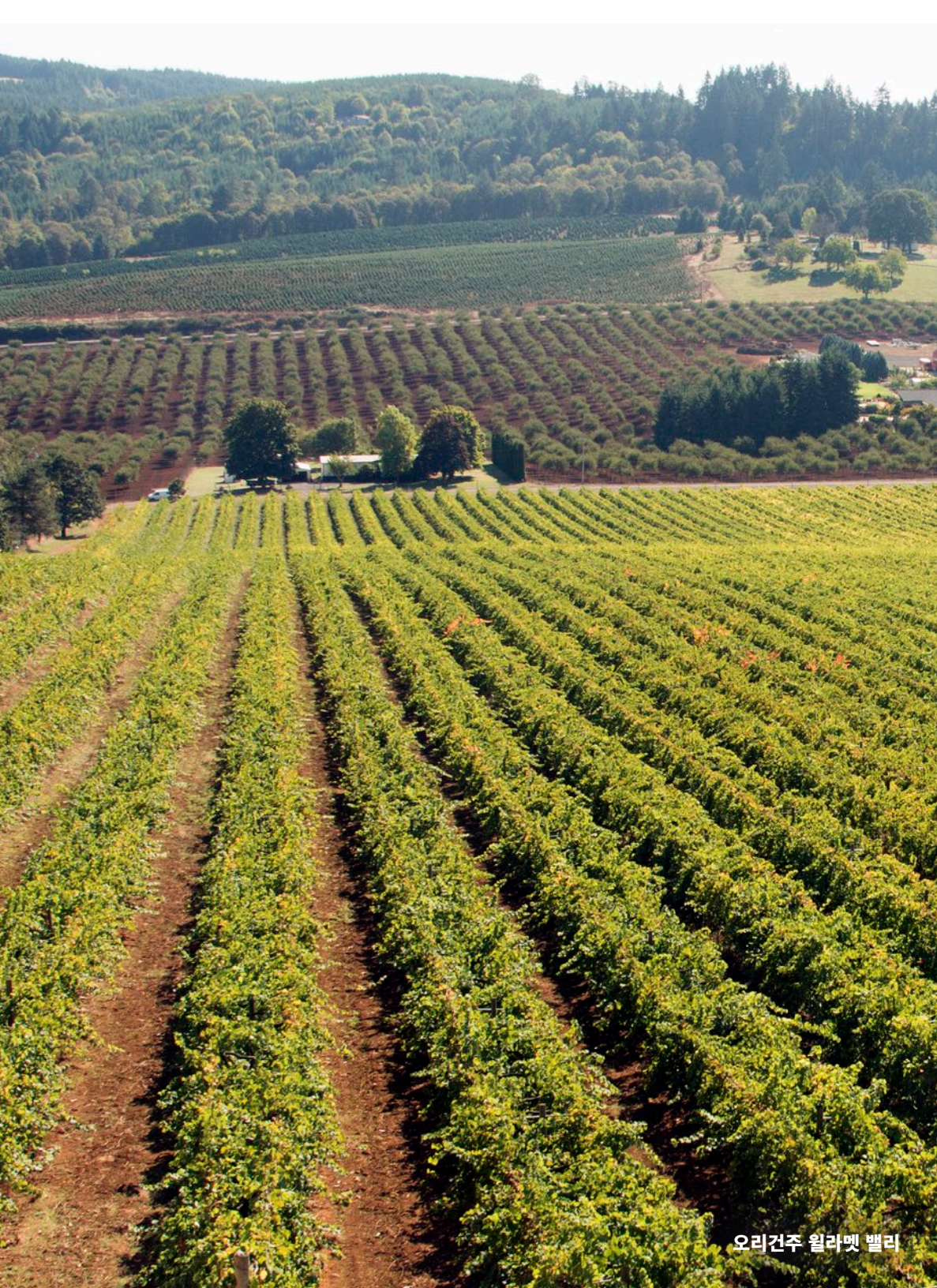
오리건주 윌라멧 밸리