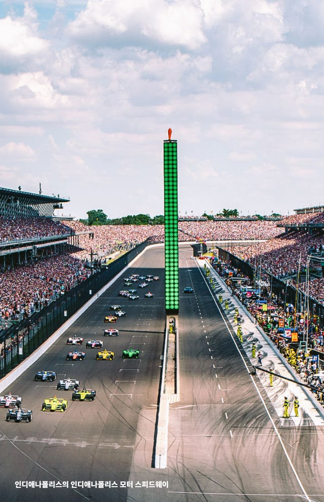
인디애나폴리스의 인디애나폴리스 모터 스피드웨이