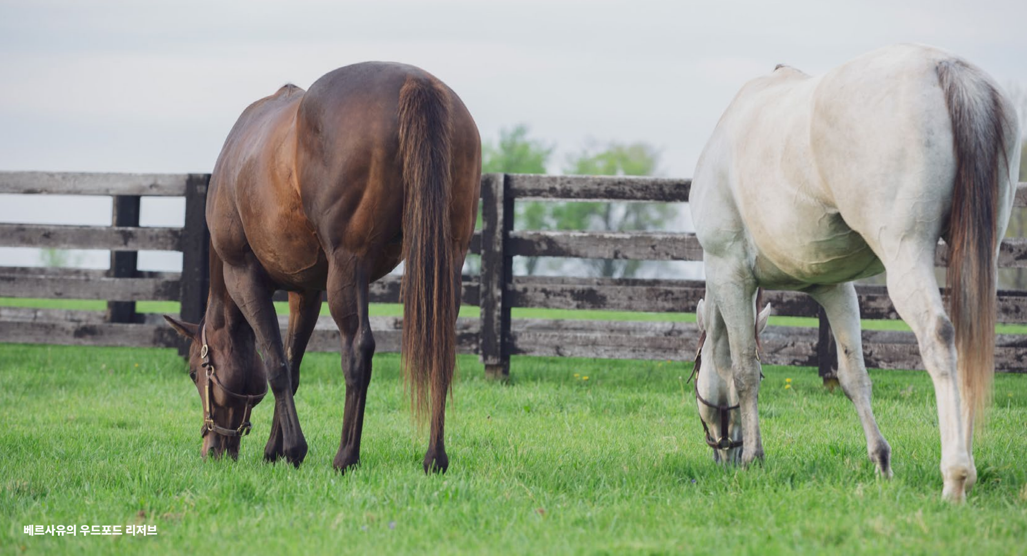
베르사유의 우드포드 리저브