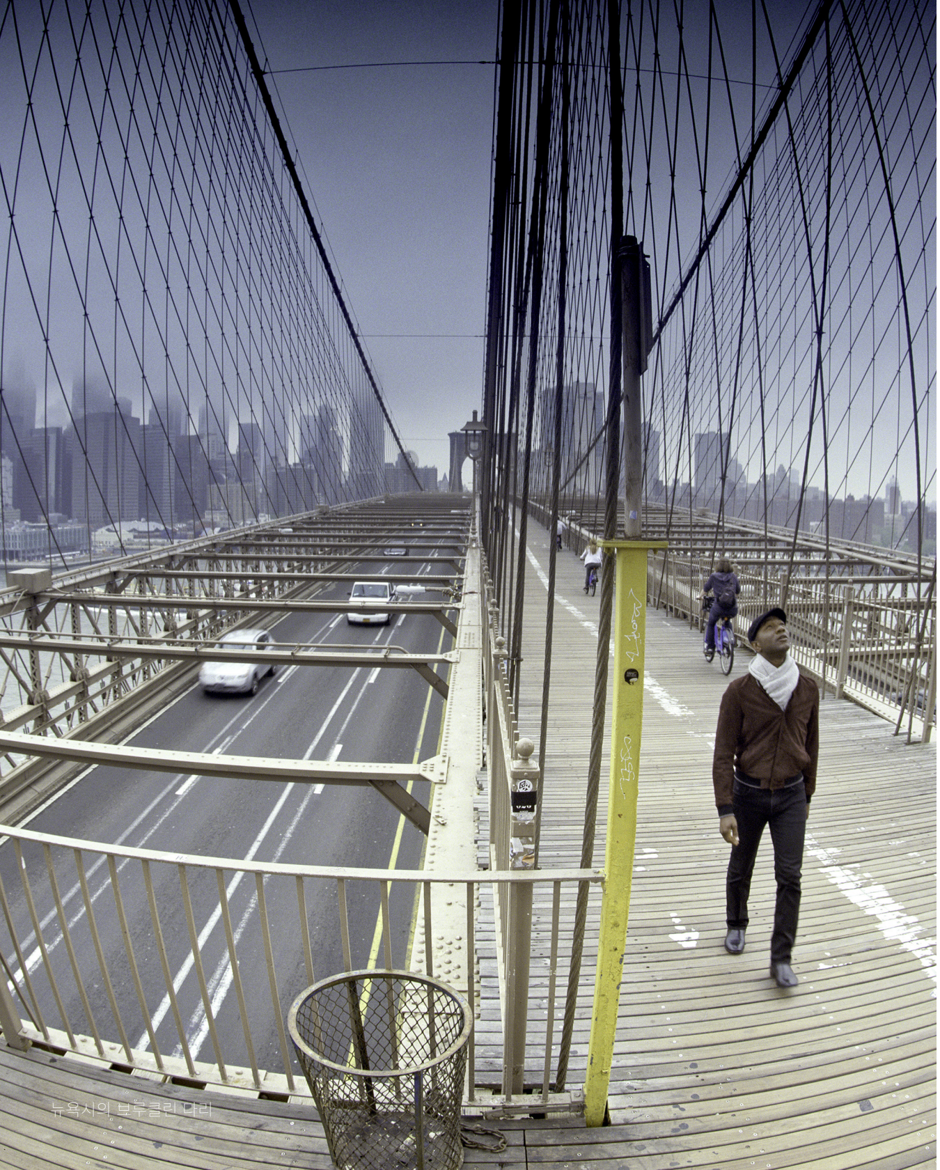
뉴욕시의 브루클린 다리