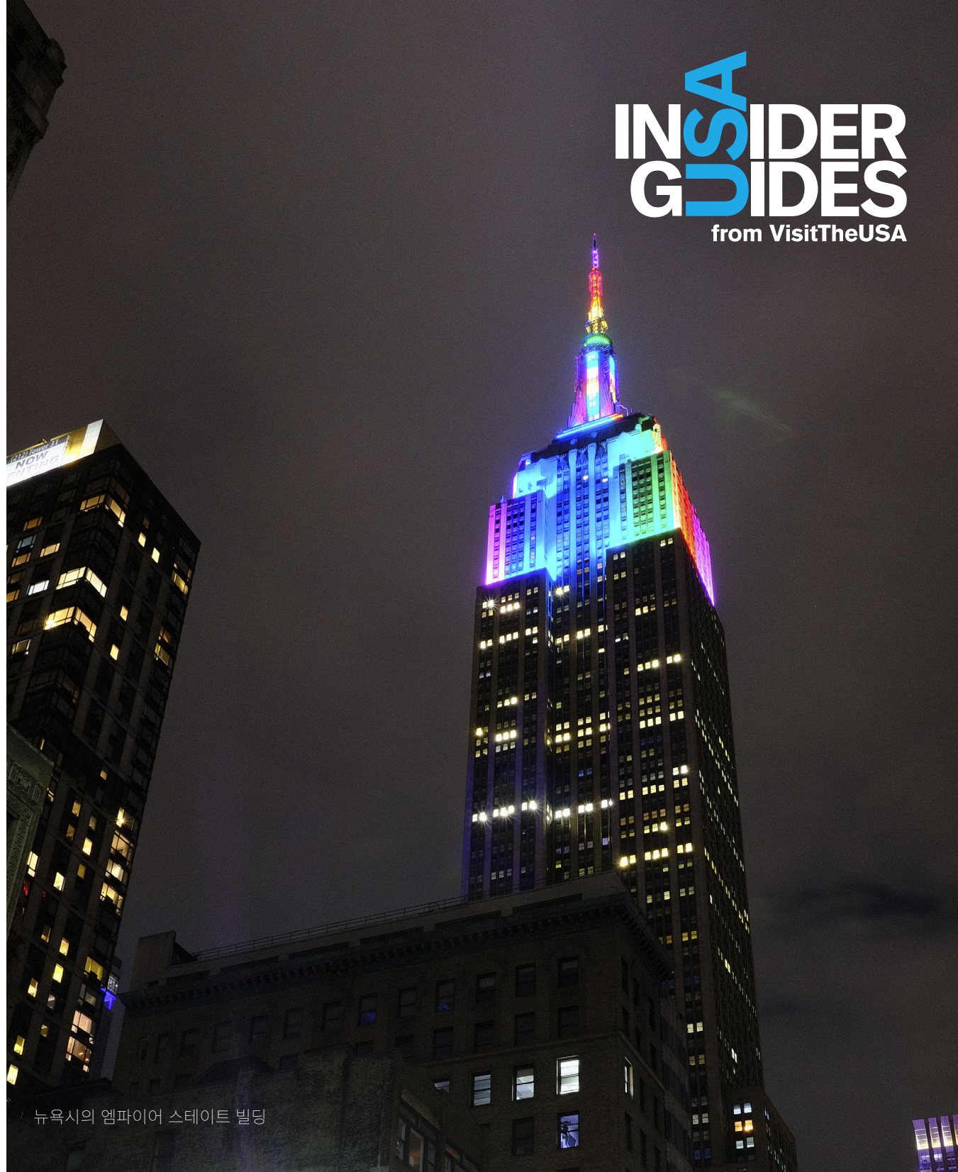
뉴욕시의 엠파이어 스테이트 빌딩