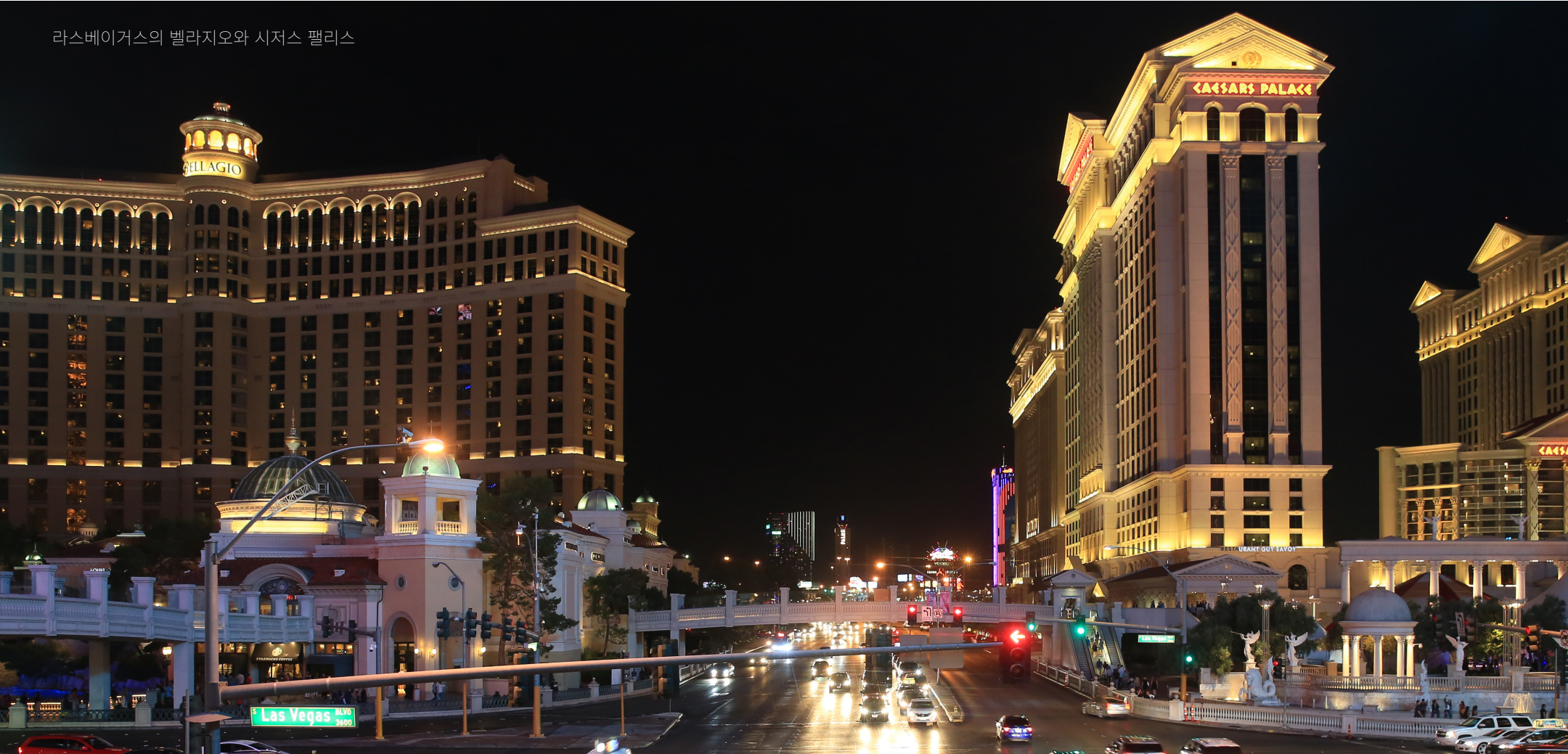
라스베이거스의 벨라지오와 시저스 팰리스