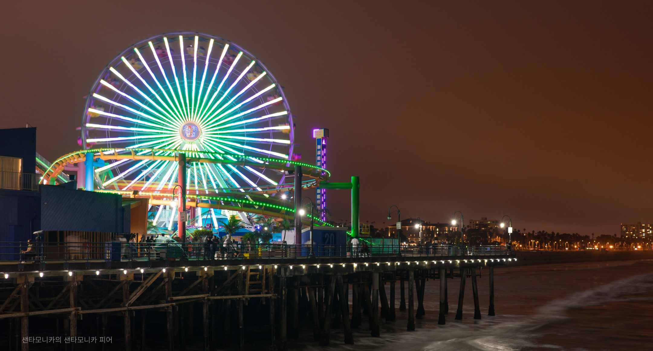
샌타모니카의 샌타모니카 피어

미국 전역의 자세한 여행 정보 및 아이디어를 보려면 VisitTheUSA.com 을 방문해보세요.