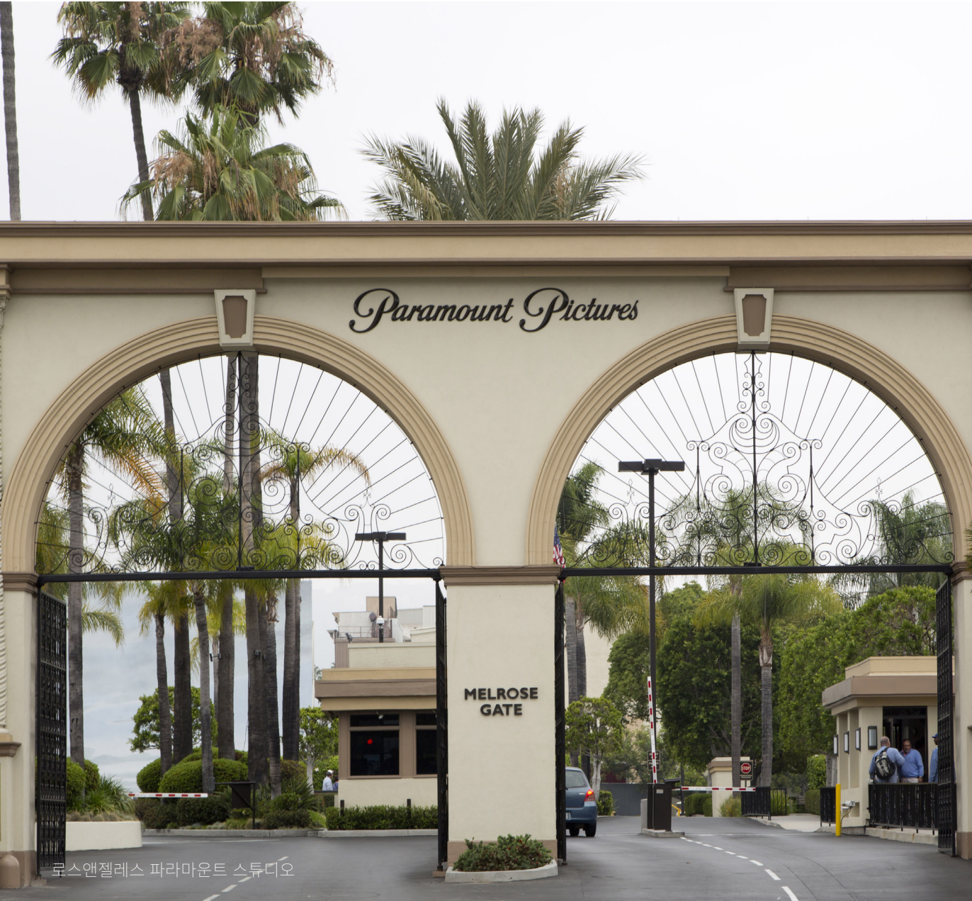
로스앤젤레스 파라마운트 스튜디오

오늘의 첫 번째 방문지는 2시간 동안 진행되는 파라마운트 픽처스 스튜디오 투어(Paramount Pictures Studio Tour)입니다. 많은 스타들이 지나갔던 문으로 들어가 세트장의 뒤편을 체험하며 야외 촬영지, 사운드 스테이지, '선셋 대로'와 '타이타닉' 같은 블록버스터 영화가 제작된 소품 창고를 탐험하세요. 스튜디오 근처에 있는 할리우드 포에버 공동묘지(Hollywood Forever Cemetery)는 많은 할리우드 스타들의 영원한 안식처입니다. 미키 루니, 세실 B. 드밀, 더글러스 페어뱅크를 비롯한 이곳에서 영원한 안식을 취하고 있는 수많은 스타들의 묘소를 찾고 싶다면 입구 꽃집에서 지도를 구매하세요. 이 묘지는 1899년 문을 열었으며 실내 묘소 2개는 물론 묘비, 기념비, 기타 독특한 표지로 표시된 실외 묘로 이루어져 있습니다. 주디 갈랜드 파빌리온(Judy Garland Pavilion)은 2017년 뉴욕의 최초 매장지에서 옮겨진 고인의 영원한 안식처입니다.