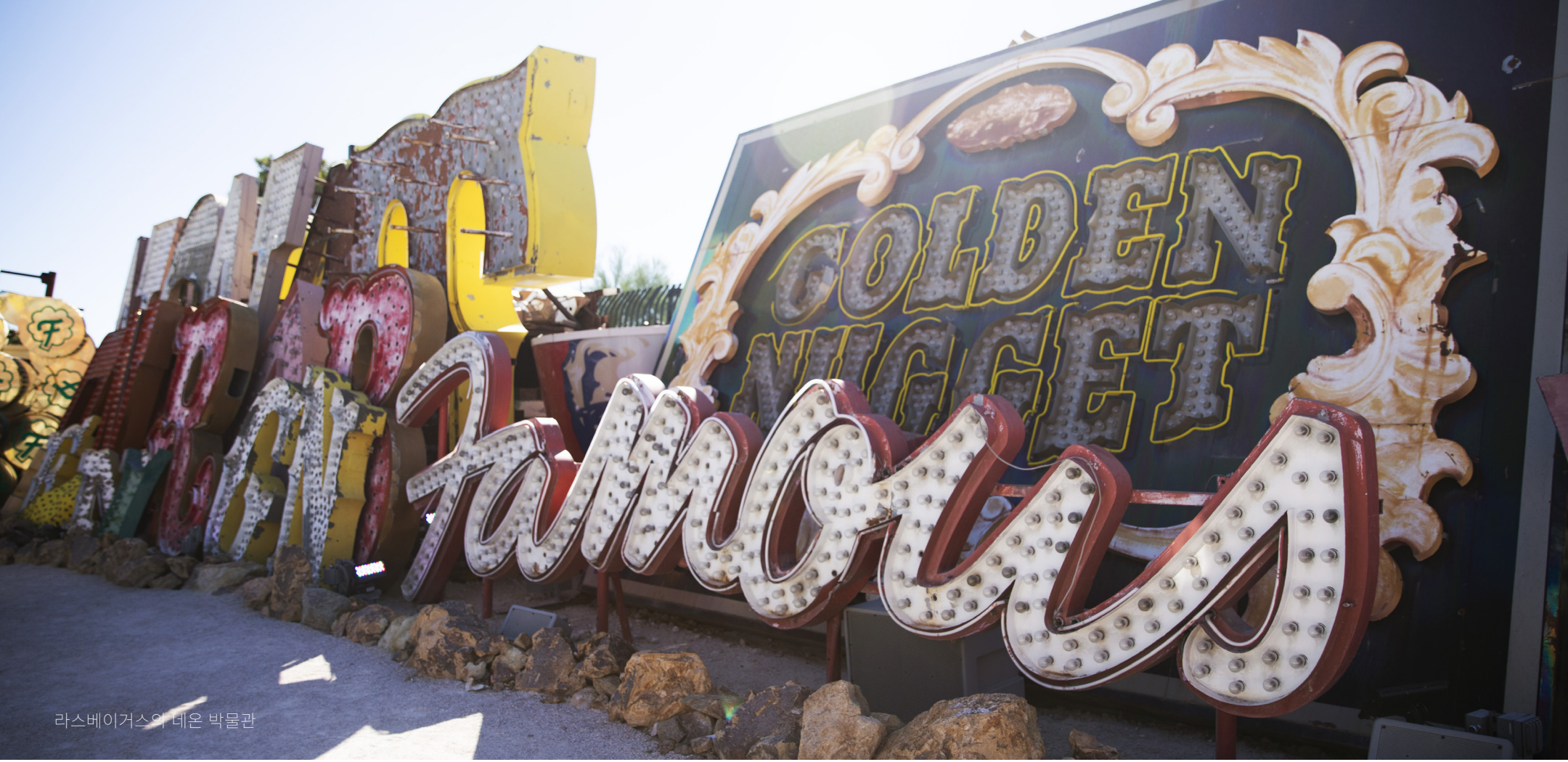
라스베이거스의 네온 박물관